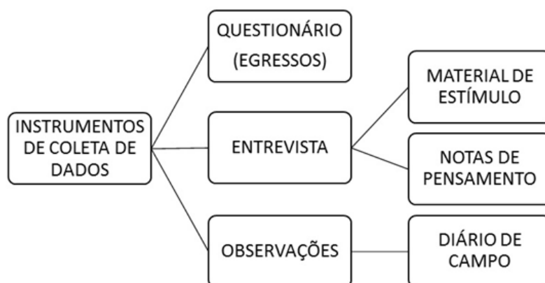
Figura 2 – Instrumentos de coleta de dados.

Recebido em: 01/07/2020 Aceito em: 27/10/2020