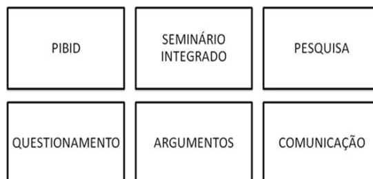
Figura 3 – Material de estímulo: palavras norteadoras.

O material de estímulo (Figura 3) foi elaborado com a intenção de representar os momentos da pesquisa em sala de aula, do Pibid e do Seminário Integrado. Cada egresso recebeu uma placa com a palavra norteadora e, a partir disso, todos foram estimulados a narrar situações atuais e/ou lembranças da época da escola.