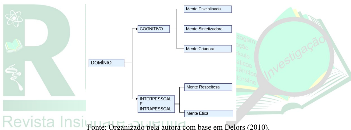
Figura 1 – Os domínios cognitivo, interpessoal e intrapessoal.