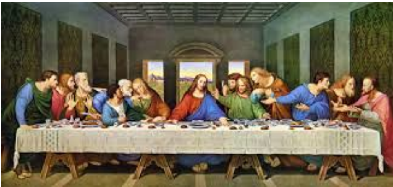
A última ceia, Leonardo Da Vinci, 1495/98