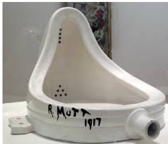
Obra: Mictório Duchamp