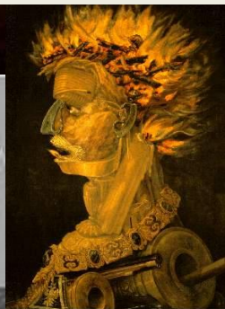
O Fogo, de Arcimboldo, Museu de História da Arte, Viena, séc. XVI