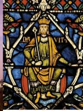
O Rei Davi, Catedral de Canterbury, Kent, Grã-Bretanha