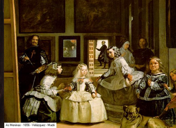
As Meninas - 1656 - Velázquez - Madri