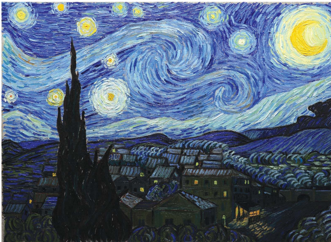
Van Gogh, A noite estrelada, 1889