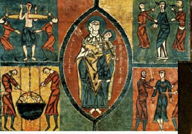
Frontal de San Quico e Santa Julita, Museu de Arte da Catalunha, Barcelona