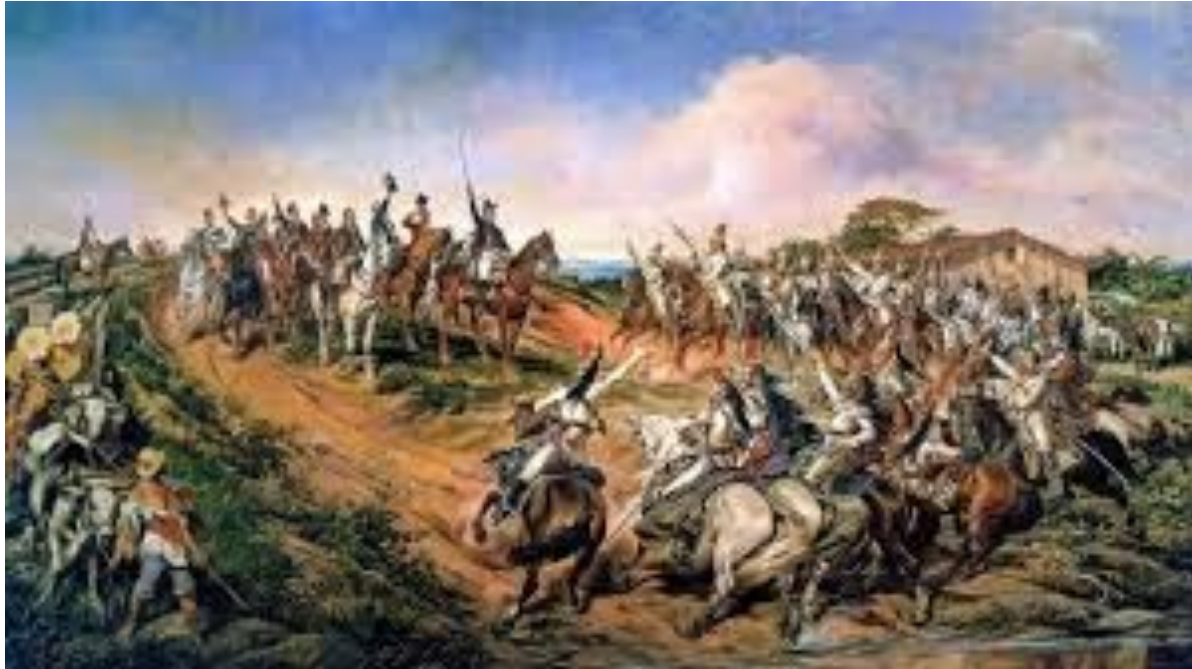
O grito do Ipiranga, Pedro Américo, 1888