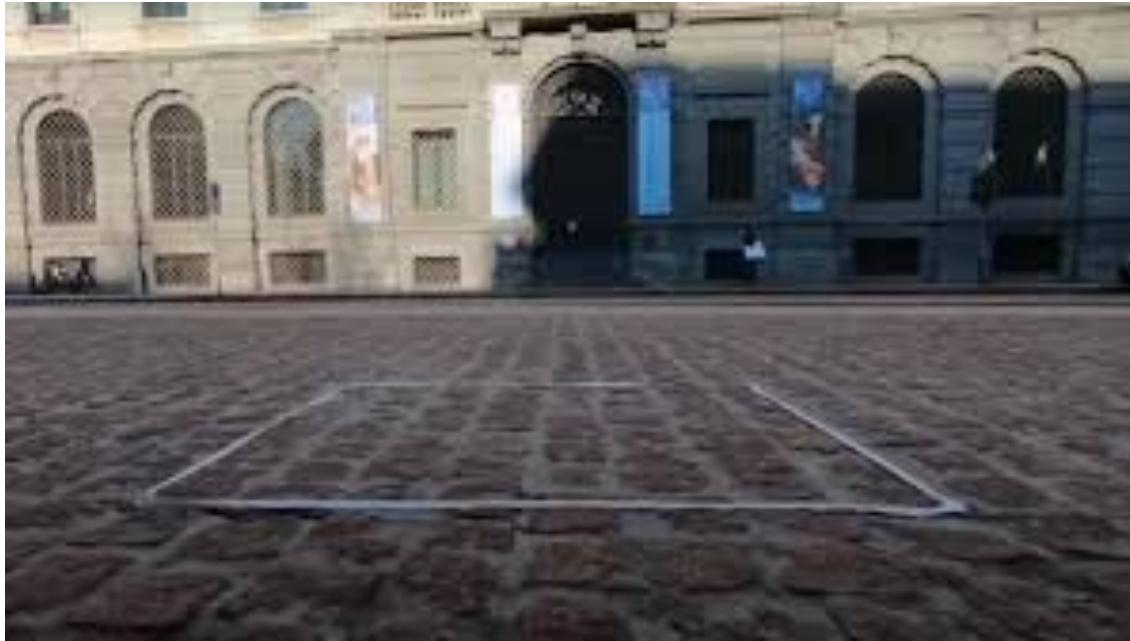
Obra: Io Sono (Eu sou) De Salvatore Garau