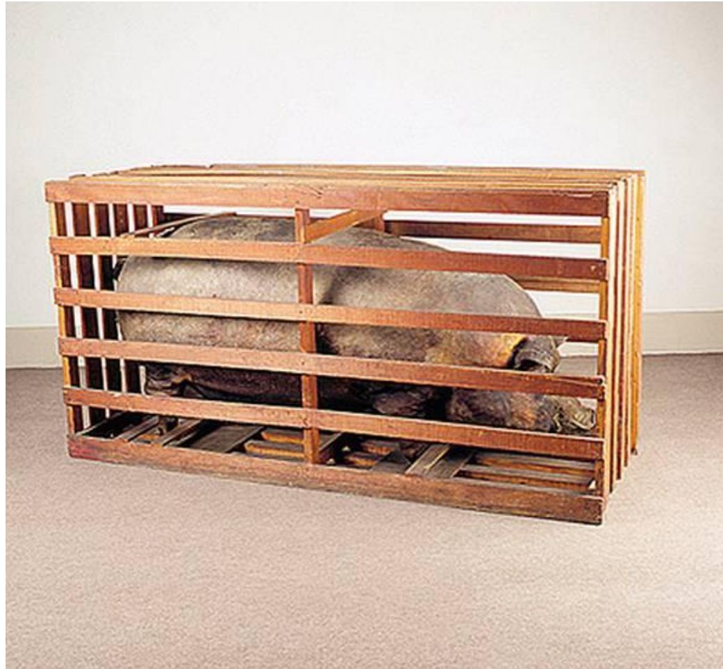
O Porco (1966) – Nelson Leiner