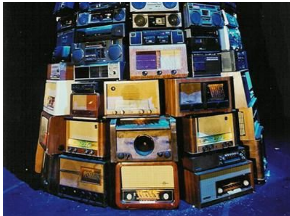
'Babel' - Cildo Meireles