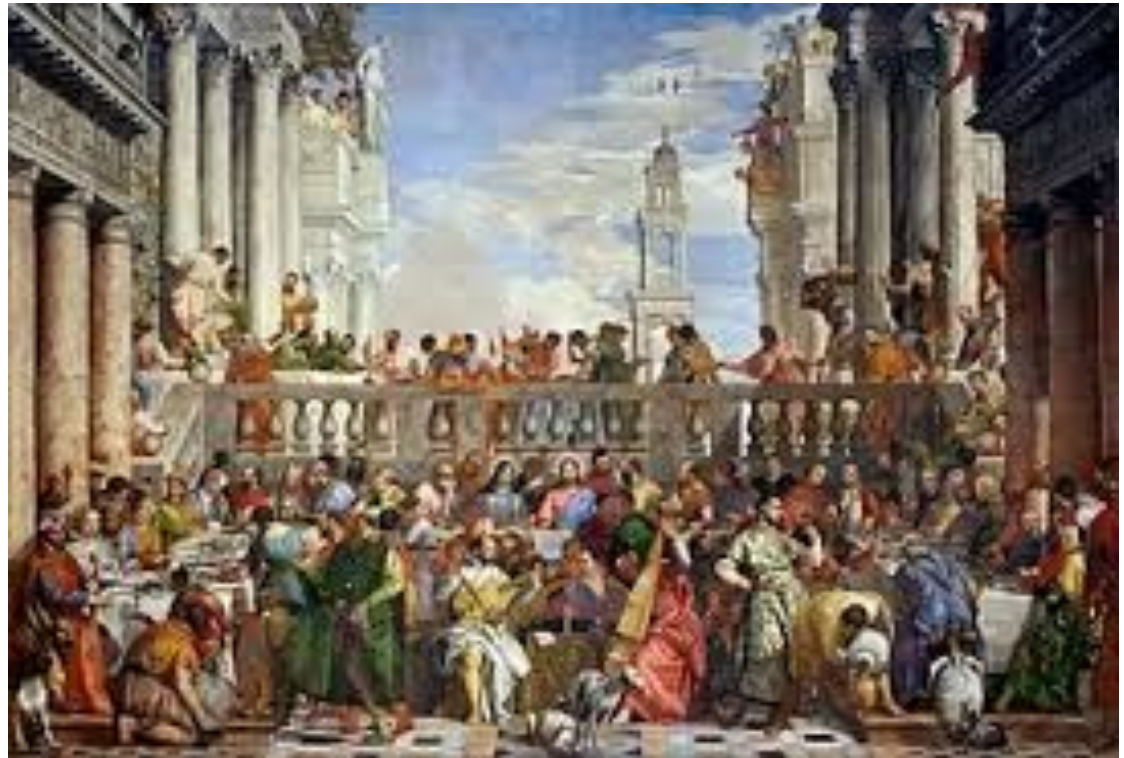
O casamento de Caná(1562/63)- Paolo Veronese 6,77 po 9,94m