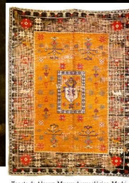
Tapete de Alares, Museu Arqueológico, Madri