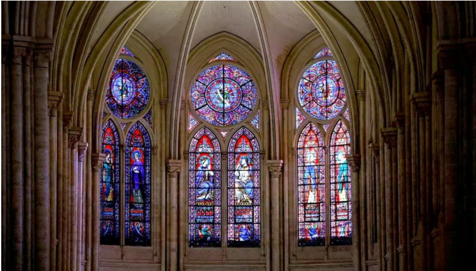
Janelas (vitrais) da igreja Notre Dame (Paris/França)