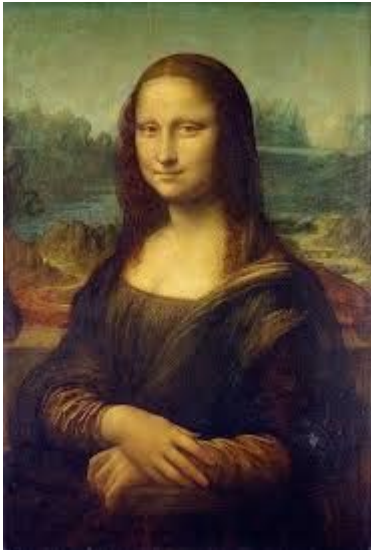
Mona Lisa(1503/06) Leonardo Da Vinci 77 cm por 53 cm